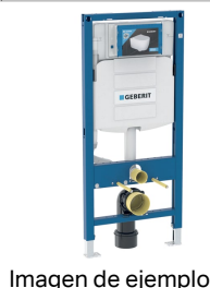
Imagen de ejemplo